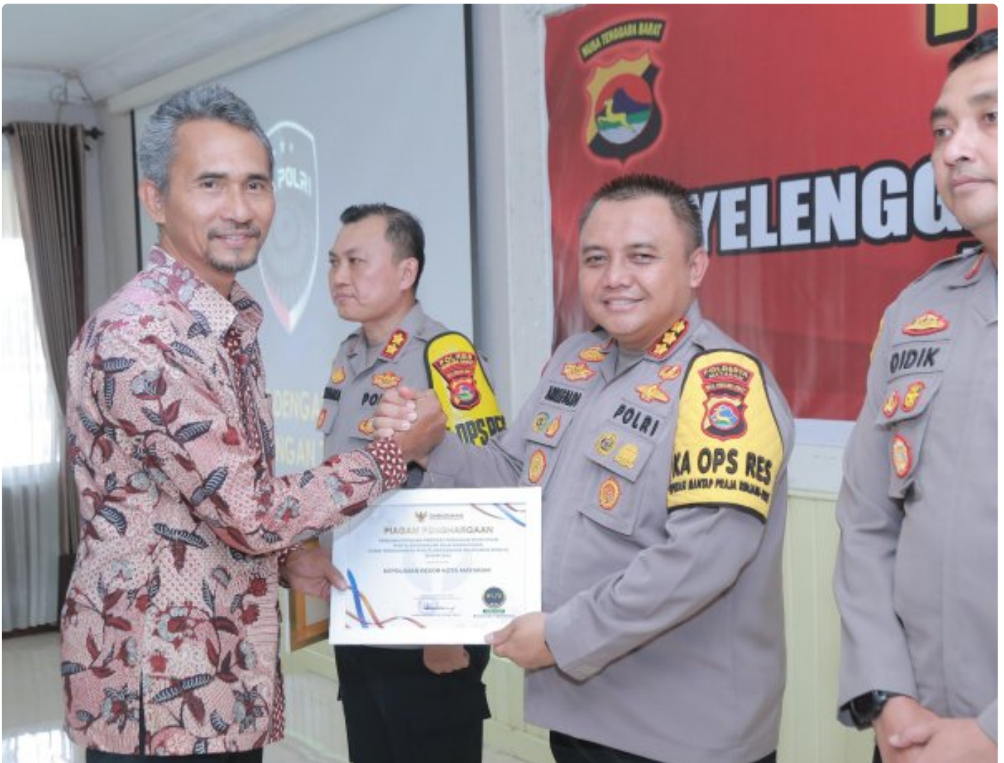
Kapolresta Mataram saat menerima Penghargaan dari Ombudsman RI perwakilan NTB, Kamis (19/12/2024)

MATARAM, NTB – Polresta Mataram kembali mengukir prestasi dengan meraih Predikat Kepatuhan Penyelenggaraan Pelayanan Publik Tahun 2024 dari